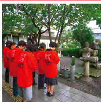
ご命日8月22日お墓参り