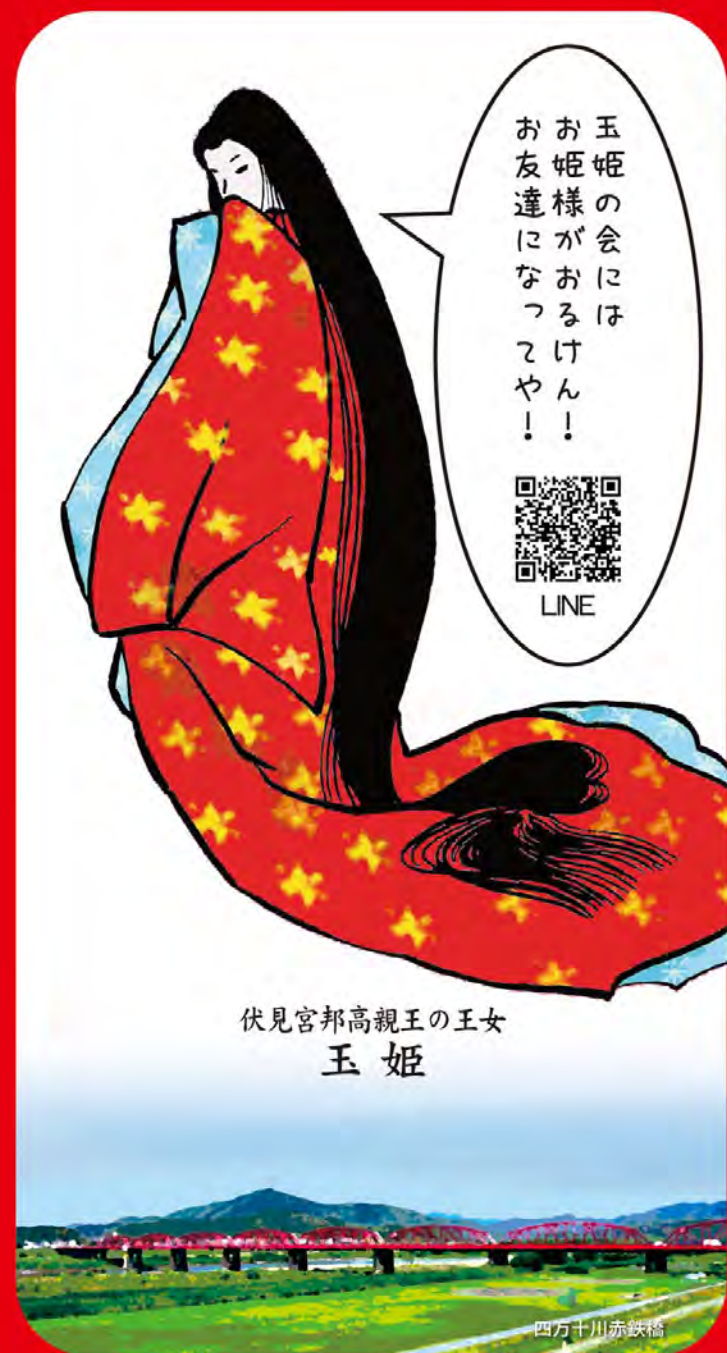
伏見宮邦高親王の王女 玉姫